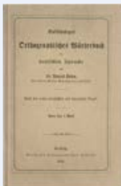
Der Urduden von 1880

Den «Duden» kennt im deutschsprachigen Raum fast jede und jeder. Aber wer steckt eigentlich dahinter? Konrad Duden (1829–1911) war Gymnasiallehrer im damaligen Preussen und trat als Philologe und Lexikograf hervor. Sein im Jahre 1880 erschienenes «Vollständiges Orthographisches Wörterbuch der deutschen Sprache» gilt als der «Urduden». Das Regelwerk und Wörterbuch (27 000 Stichwörter auf 187 Seiten) wurde 1901 auf einer staatlichen Rechtschreibkonferenz für alle Gliedstaaten des Deutschen Reiches für verbindlich erklärt. 1902 schlossen sich Österreich und die Schweiz diesem Vereinheitlichungsbeschluss an. Damit war die einheitliche deutsche Rechtschreibung erstmals in der Geschichte Wirklichkeit. Später übernahm ein privater Verlag den «Duden» und führte ihn von Auflage zu Auflage fort. Staatliche Beschlüsse wie diejenigen von 1901/1902 gab es später keine mehr, aber der «Duden» blieb bis zur Rechtschreibreform von 1996 die unangefochtene Rechtschreibinstanz. «Schlag im Duden nach!» wurde zum geflügelten Wort nicht nur in Rechtschreibfragen, sondern in Fragen zur deutschen Sprache überhaupt. Der Name «Duden» zielt denn nun auch längst nicht mehr nur Rechtschreibwörterbücher, sondern beispielsweise auch eine Grammatik, Sachbücher zu sprachlichen Themen und vieles mehr. In seiner 26. Auflage von 2013 umfasst der Rechtschreibduden 140 000 Stichwörter und 1216 Seiten.